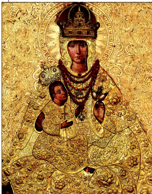
Trakų Dievo Motinos paveikslas su apkaustais, 1994 m. nuotrauka iš Trakų istorinio nacionalinio parko direkcijos rinkinių.