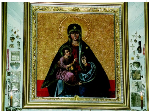
Trakų Dievo Motinos paveikslas.

Lietuvą valdant Jogailos broliui ir vietininkui kunigaikščiui Skirgailai (1382–1392), Trakuose apsigyveno daug rusų stačiatikių. Jie mieste pasistatė cerkves ir vienuolynus: jau 1384 metais minima Skaisčiausiosios Dievo Motinos gimimo cerkvė ir vienuolynas pietiniame miesto gale, 1424 metais Kristaus